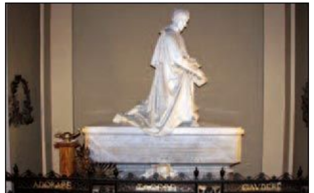
Il monumento funebre di Antonio Rosmini, nella chiesa del SS. Crocifisso di Stresa.