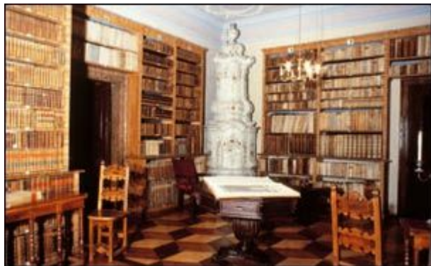
La biblioteca del palazzo paterno a Rovereto.

guente, dormiva dimenticata nello studiolo dell'autore, non parendo i tempi propizi a pubblicar quello ch'egli aveva scritto più per allevamento dell'animo suo, afflitto dal grave stato in cui vedeva la Chiesa di Dio, che non per altra ragione. Ma ora che il Capo invisibile della Chiesa collocò sulla Sedia di Pietro un pontefice che par destinato a rinnovare l'età nostra e a dare alla Chiesa quel novello impulso che deve spingere per nuove vie ad un nuovo corso quanto impreveduto altrettanto meraviglioso e glorioso; si ricorda l'autore di queste carte abbandonate, né dubita più di affidarle alle mani di quegli amici che con lui dividevano in passato il dolore e al presente le più liete speranze».