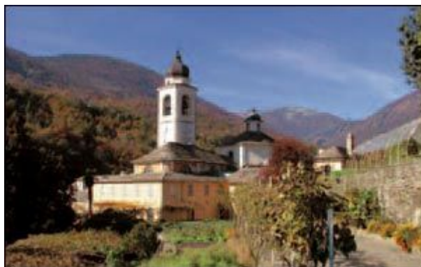
Il Calvario del Sacro Monte di Domodossola, in Piemonte.

Rosmini si sofferma quindi sui requisiti dei candidati all'episcopato: dovrebbero essere «santità e prudenza». Ma se l'ultima parola spetta all'autorità politica, difficilmente la scelta cadrà su un uomo dotato di queste virtù: più facilmente, se ne preferirà uno gradito al potere. Anche nel caso della nomina dei vescovi, la soluzione sta nel recuperare la lezione delle prime comunità cristiane, nelle quali il pastore era eletto perché «il migliore di quanti se ne possono avere», «un uomo grave, maestro in teologia o in diritto», «un sacerdote conosciuto, amato e voluto da tutti quelli a cui egli deve comandare, il che vuol dire da tutto il clero e il popolo della diocesi a cui è destinato».