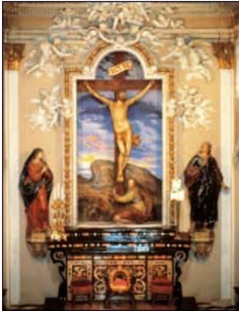
L'altare del santuario del Crocifisso al Sacro Monte Calvario di Domodossola.

ministrarlo senza renderne conto alla comunità.