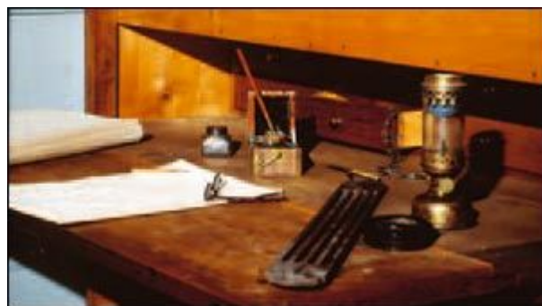
Lo scrittoio di Rosmini a Villa Bolongaro, a Stresa.

Per istruire al meglio i fedeli occorre, però, un clero all'altezza della situazione. E qui Rosmini passa a descrivere la seconda piaga, quella della mano destra: «L'insufficiente educazione del clero». Dopo aver ricordato che «la predicazione e la liturgia erano nei più bei tempi della Chiesa le due grandi scuole del popolo cristiano: la prima ammaestrava i fedeli colle parole; la seconda colle parole insieme con i riti», indica nella sommaria formazione teologica del clero il nodo cruciale da affrontare. Il clero – denuncia – è insieme vittima e causa della povertà culturale delle comunità cristiane. Punta quindi il dito contro l'arretratezza e superficialità dei libri di testo usati nelle scuole di teologia, «ciò che di più meschino e di più svenevole fu scritto nei diciotto secoli che conta la Chiesa: libri, per riassumere tutto in una parola, senza spirito, senza principi, senza eloquenza e senza metodo...».