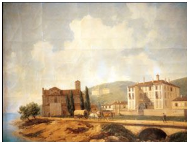
Stresa in una stampa dell'800.

Sub iudice il pensiero del Roveretano lo è rimasto fino al 1° luglio 2001, quando una Nota della Congregazione per la dottrina della fede firmata dall'allora prefetto Joseph Ratzinger e dall'allora segretario Tarcisio Bertone, ha accolto l'obiezione da tempo presentata da numerosi studiosi del pensiero rosminiano. E cioè che l'estrapolazione delle singole proposizioni racchiuse nel Post Obitum non corrisponde al pensiero autentico dell'autore. «Di Rosmini», ha commentato il vescovo di Novara Renato Corti, presentando il cammino diocesano che accompagna questa beatificazione, «mi ha sempre impressionato la libertà interiore, anche di fronte alla prospettiva di dover affrontare molte difficoltà». Oggi in questa libertà interiore la Chiesa riconosce il tratto della santità. Additando ai cattolici un testimone prezioso sul difficile (e quanto mai attuale) versante della carità intellettuale.